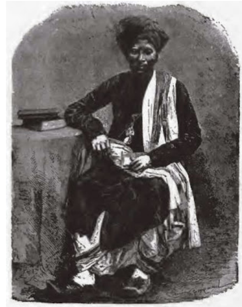
Banian (cf. Seite 2)